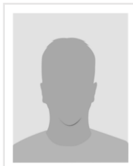
Kestel, Uwe 62 Bergmann/ Unternehmer